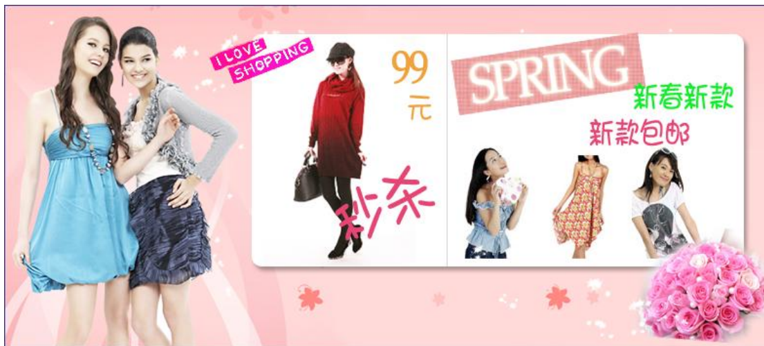
图 1:网店促销区域的制作效果图

“佳 X 元”是某城市一家专门销售女式时装的服装店，为了拓展客户市场，“佳 X 元”在淘宝开店来进行网上销售。请根据素材文件夹下提供的素材为其网店进行促销区域的制作和美化。网店促销区域的制作效果如下图所示: